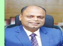
सय जनालाई व्यवस्थापन गर्न सक्छौ शैक्षिक हितवाले प्रयोग गर्न खोजिरेकेको छौ । विन अरु अरु ठाउँका लागि पनि यही ल्याएर राखौ । अलग अलग ठाउँमा व्यवस्थापन गर्दा धेरै खर्च हुन्छ । उद्धार गरेर ल्यायो राख्यो, अनि त्यसपछि सेक्टरमा पठाउने व्यवस्था मिलाउनुपर्छ । १८ करोड भनेको सानो ठाउँ छैन त्यहाँ उनीहरुलाई कुनै यस्तो काम अल्काउने जुन उनीहरुलाई मन पर्छ बन्द गरेर राख्नु हुँदैन, छिटो स्वस्थ पार्नुछ भने केहि न केहि गतिविधिमा लगाउनुपर्छ । उनीहरुको जिविकोपार्जन पनि गराउन सकिन्छ । मानव सेवा आश्रमको भवन बनाउन अन्य पालिकासँग पनि सहयोगका लागि कुर भईरहेको छ कि अब छिदै आसपासको सबै पालिकालाई बोलाउँछौ महानगरसँग जोडिएका वाराको कलेज जीपुत्र मिमरा उपमहानगरपालिका विश्रामपुर गाउँपालिका छन्, जिल्लाको परिचर्मातर पसांगढी, बहुदरमाइ नगरपालिका छ । बन्दिबासिर्ना गाउँपालिका छ । त्यहाँका प्रमुखलाई बोलाउँछौ, दानवीरलाई बोलाएर अभियान नै सञ्चालन गर्छौ । छिटो बढ्छौ पैसाको बन्दोबस्त होस न मानव सेवा आश्रमको भवन बनाउनु भन्नेमा हाम्रो ध्यान छ ।

बाँझिने र उनीहरुलाई पाल्नुपर्ने रहेछ । यो स्थितिलाई यस्तै रहने कि परिवर्तनका लागि केहि गर्नुहुन्छ ? मानवीयताको कुनै सीमा हुँदैन, अमीरकामा गएर कोहि मानिस अलपत्र भइँदा त्यहाँको सरकारले हेर्नुपर्छ । यहाँ के देखियो भने धेरै मानिसहरु मानसिक सन्तुलन गुमाएर आउँछन् । उद्धार गरे, उपचार गरेर ठिक पारेर घर फर्काइएको छ । कुनै पनि मानिस मानसिक सन्तुलन गुमाएको छ भने उसलाई थाहा नै हुँदैन । उसलाई उद्धार गरेर राख्नुपर्छ । उपचारको क्रममा थोरै थोरै कुरा बताउँछन्, त्यसपछि घर खोजेर पठाइन्छ । अभियान वशीभरी सञ्चालन गर्ने उद्देश्य छ । २०२२ जना सामाजिक सेवामा सक्रिय युवाहरु यसमा लागेका छन् । चाडपर्वको समयमा मानसिक सन्तुलन ठिक नभएर भौतारिँदै आएका मानिसलाई उद्धार गर्छौ । चाडवाडमा कसैलाई सडकमा अलपत्र बस्नु नपरोस, छत सबैले पाउन, एक रातका लागि भएपनि वेवारिसै बस्नु नपरोस भनेर अभियान चलाएका छौ । मानव सेवा आश्रमका लागि बढी के गर्ने योजना महानगरले बनाएको छ ? जहाँ राखिरेकेका छौ, त्यहाँ ६१ जना छन्, त्यो ठाउँले पुगिरहेको छैन । ठूलो फराकिलो ठाउँ चाहिन्छ, जहाँ २-३